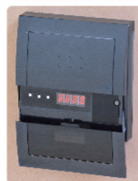
▲カバーオープン時