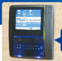
CENTiO XP35C6 シリーズ