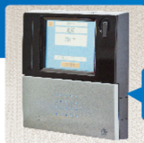
AcCENTiO XRC200 シリーズ